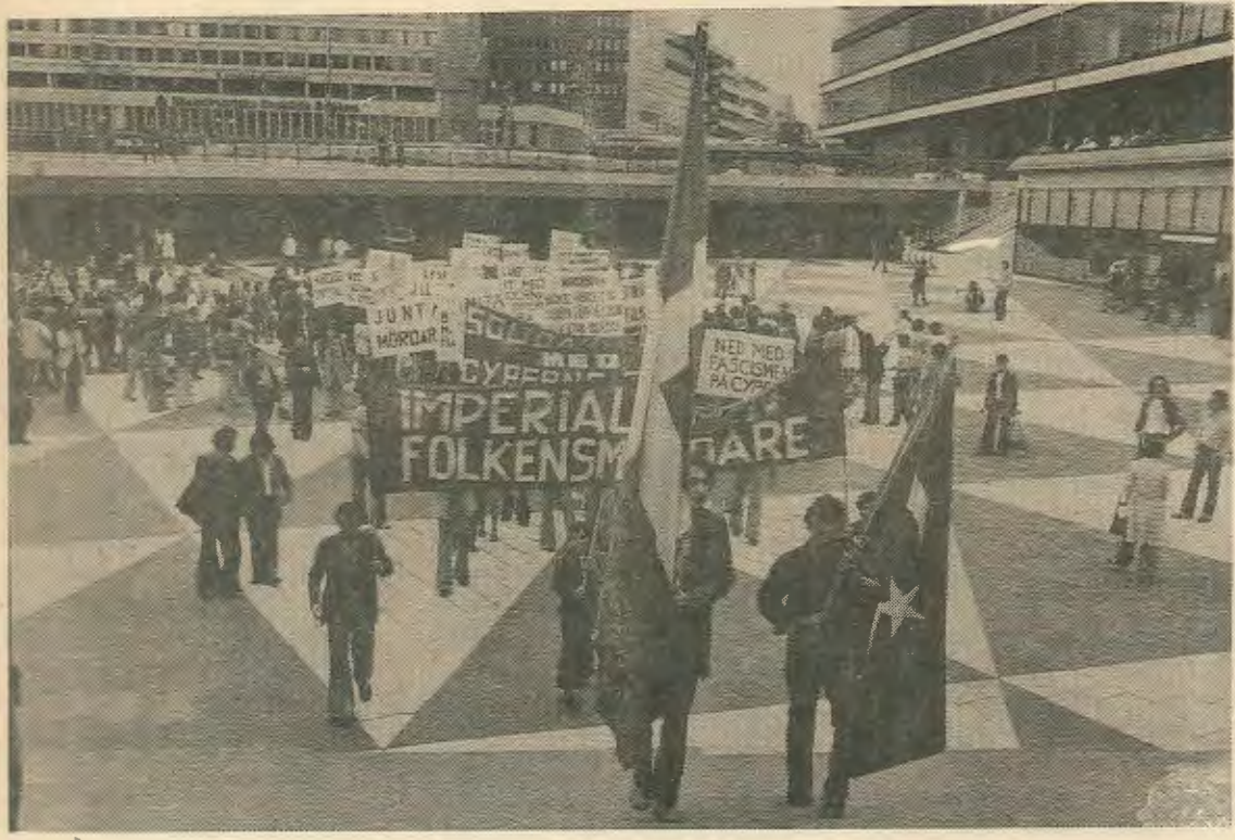
Διαδήλωση Τουρκοκυπρίων και Έλληνοκυπρίων στην Σουηδία ενάντια στον ιμπεριαλισμό.

τα χωριά στον κόσμο που ζει εκεί. Έκεί όμως όπου υπάρχουν τσιφλίκια με καπιταλιστικόν τρόπον οργανωμένα, πρέπει να τα πάρει το κράτος. Δεν χρειάζεται να τα μοιραστούν αυτά γιατί εργάζονται με μοντέρνο τρόπο.